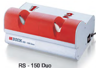
RS - 150 Duo