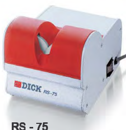
RS - 75